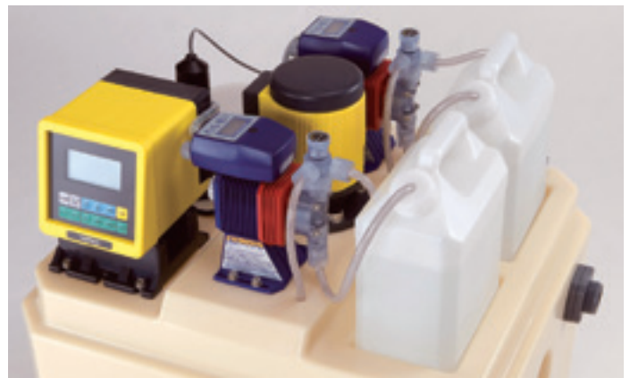
機器を効率的に配置して、省スペースを実現。