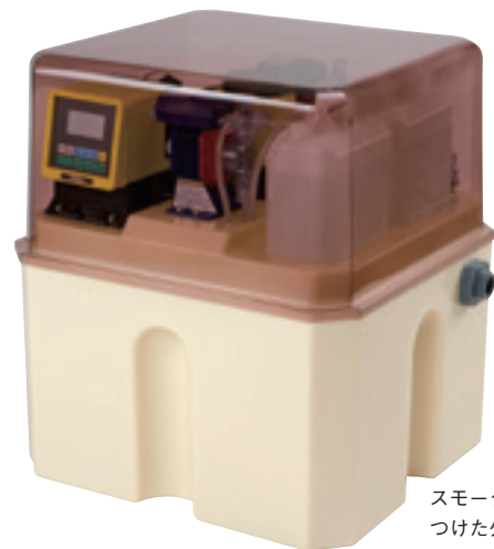
スモークカバーをつけた外観