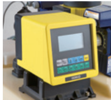
豊富な機能の付いたデジタル pH 調節計