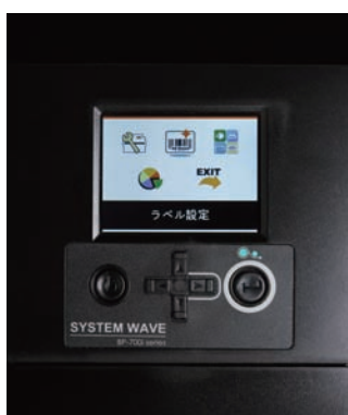
カラー液晶モニター搭載

大型で見やすいカラー液晶モニターを搭載し、プリンタの設定もわかりやすく、エラーのときにはすぐに状況がわかります。IPアドレスの設定も可能です。