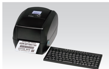
スタンドアロンキーボード