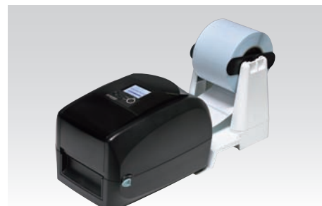
外部ロールホルダー(LH-110)