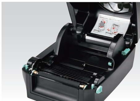
●ラベルセットが簡単なフルオープン機構