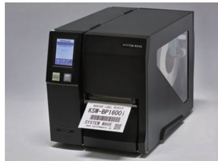
銘板専用プリンタ(KSW-BP1600i)