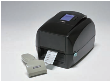
Bluetoothスキャナーによるデータ入力