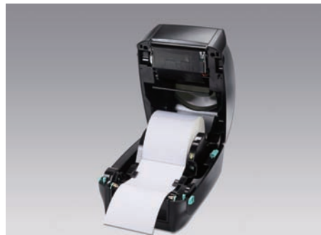
ラベルセットが簡単なフルオープン機構