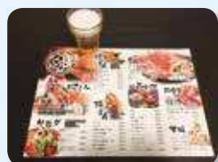
飲食店のメニュー