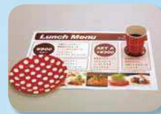
メニュー、ランチョンマット