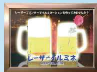
店頭ポスター、ご案内