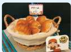
商品POP、プライスカード