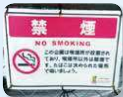
街中、公園の掲示物