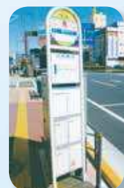
バス停時刻表、掲示物