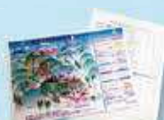
登山マップ、遠足のしおり