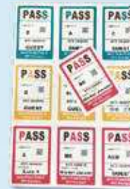
ゼッケン、イベントワッペン