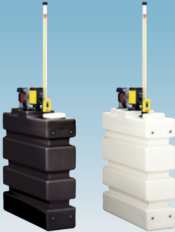
ポンプ攪拌機架台付