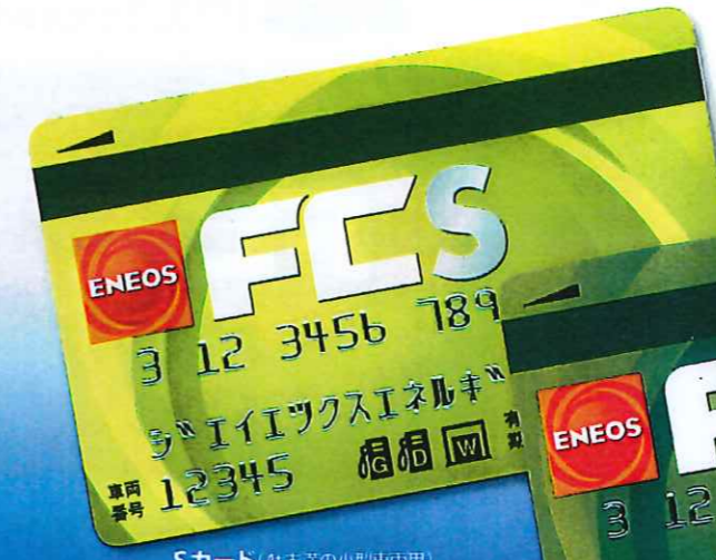
Sカード(4社未満の小型車専用)