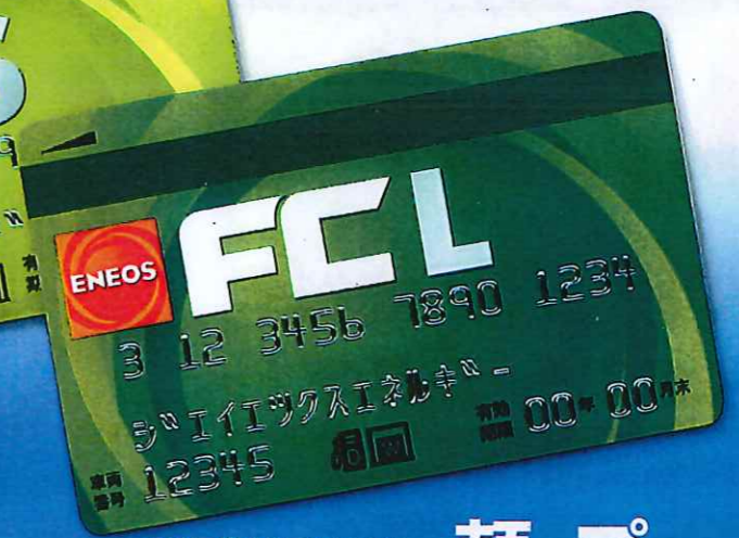
Lカード(4社以上の大型車専用)